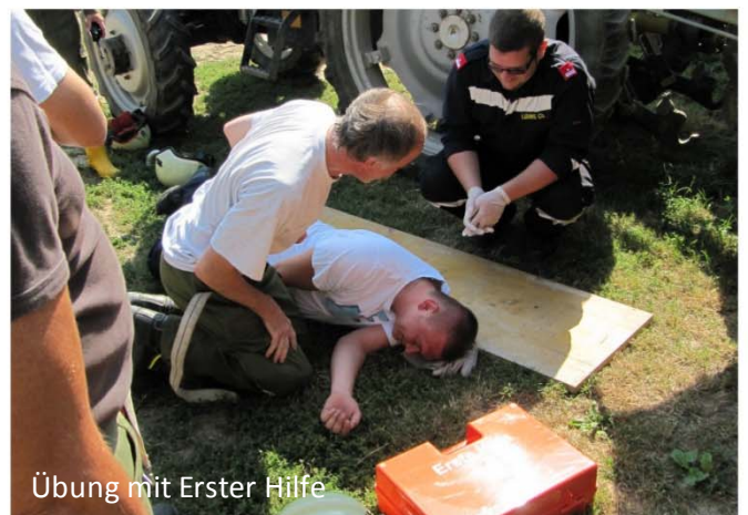
Übung mit Erster Hilfe