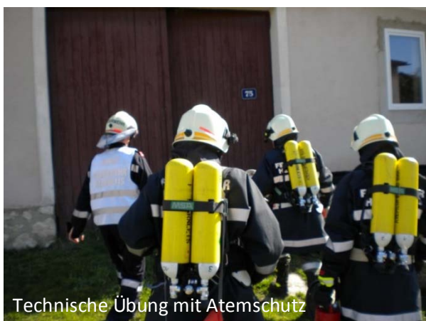
Technische Übung mit Atemschutz